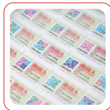
支持可变条形码和彩色二维码